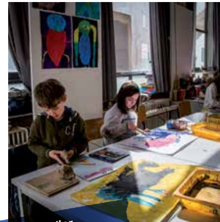
Beeldatelier 1ste graad

De Sint-Lucas Academie nodigt je dan ook uit om samen op weg te gaan in een persoonlijk en artistiek proces. Iedereen – vanaf 6 jaar tot een zeer respectabel veelvoud ervan – kan in onze academie haar of zijn kunstzinnige gading vinden.