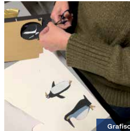
Grafische vormgeving en illustratie

Voor deze richting kan je opleidingscheques aanvragen.