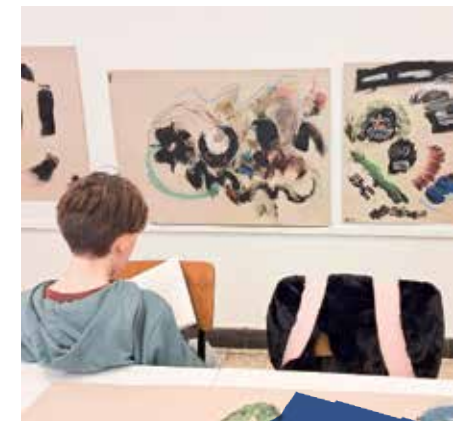
Beeldatelier 2de graad

Ieders werk is anders en niets is te gek!